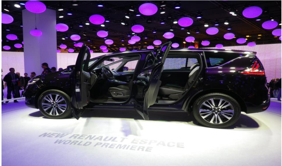
パリモーターショーで発表されたルノー新型「Espace」